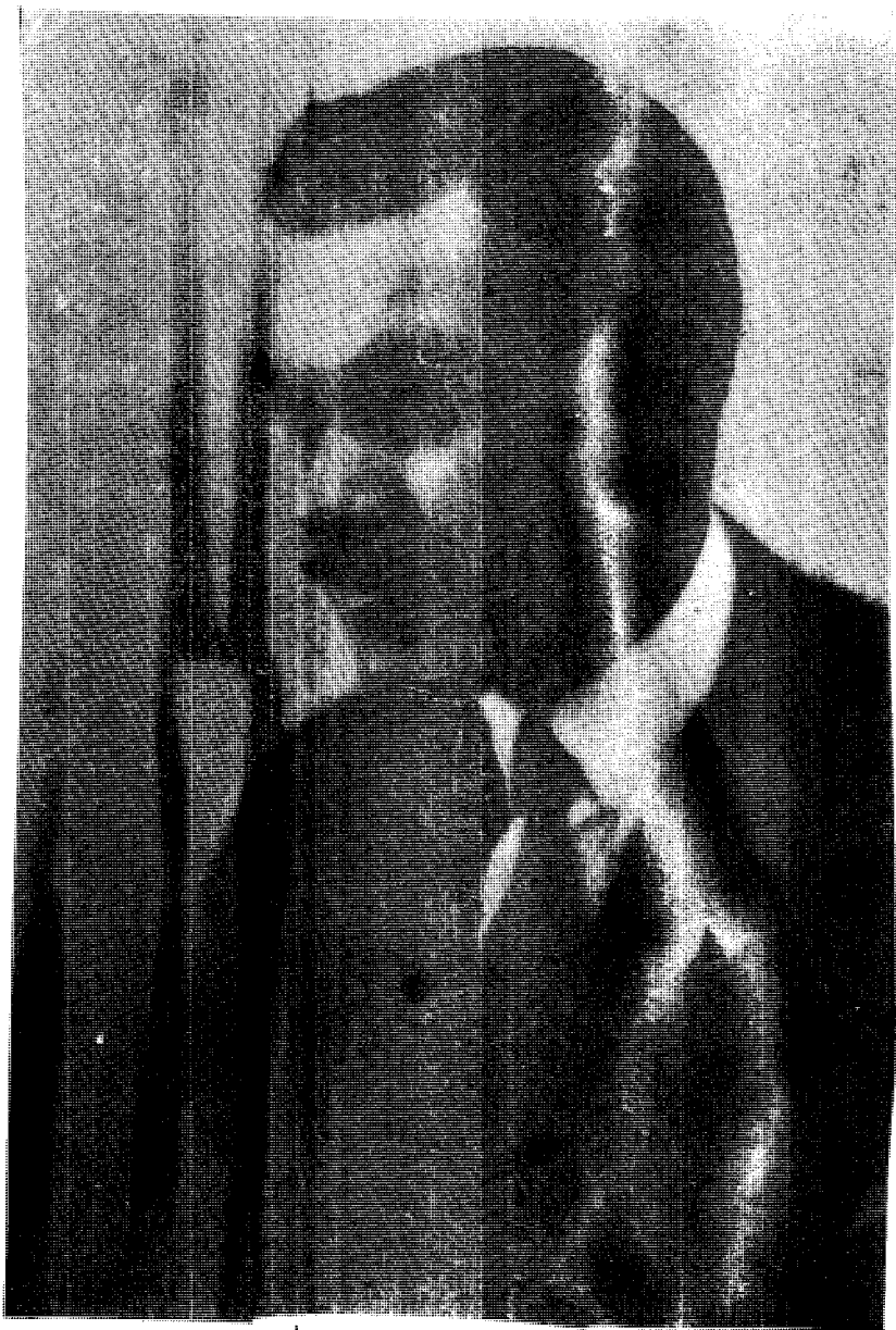
الموافق ليرروب ستودارد