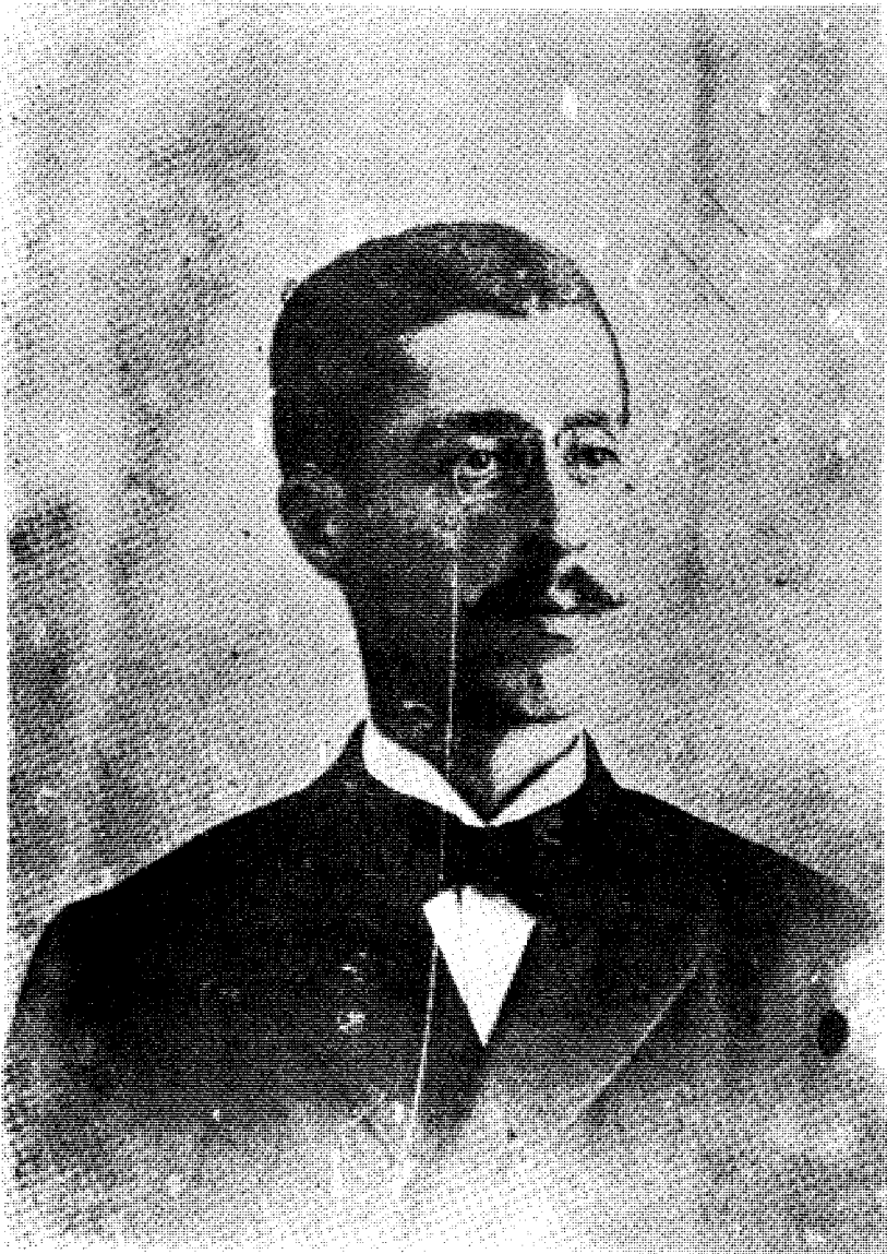
الامير شكيب في الخامسة والعشرين من عمره - كانون الثاني ١٨٩٥